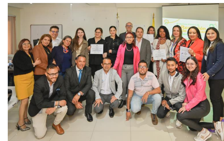
DT Boyacá, Casanare