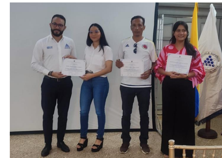
DT Atlántico, Cesar, Magdalena, La Guajira